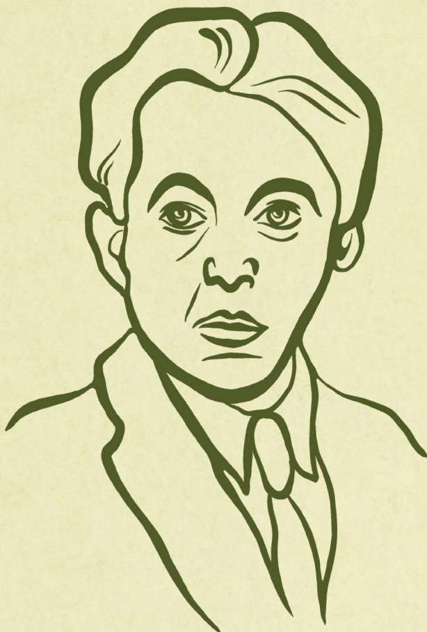
Vincas Krėvė-Mickevičius (1882–1954)